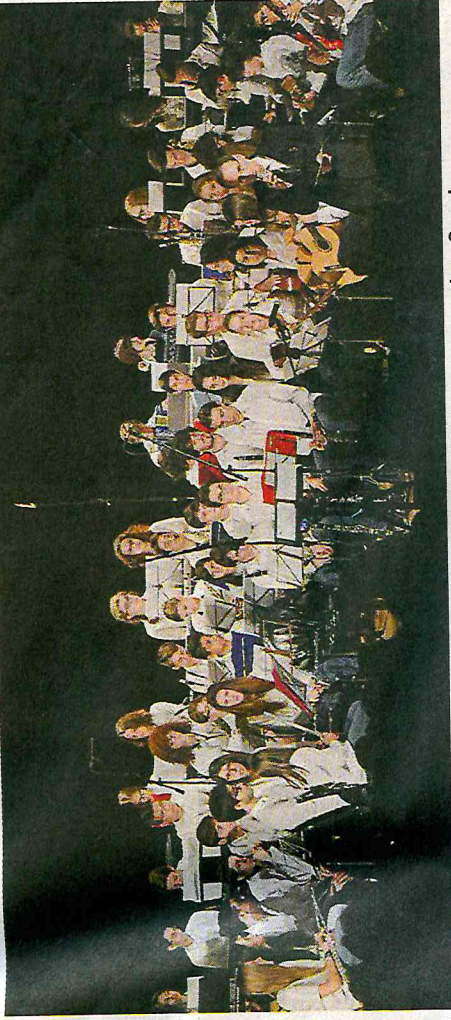
MUSICISTI I componenti dell'orchestra dell'indirizzo musicale dell'istituto comprensivo «Grossi»

fronto con l'Arcivescovo in piazza, infatti, quest'anno non sarà solo il punto di arrivo della marcia, ma il momento centrale dell'intera mattinata».